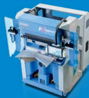
Elektro- Mechanische Abkantmaschinen