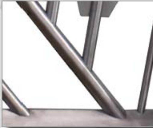
Qualität machen mit der Robo 30