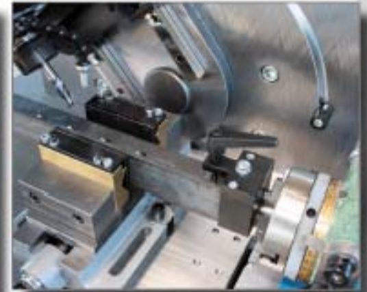
2 Einlegebacken und Zusatzspanner für T, Flach und Vierkant