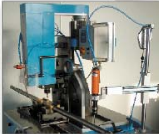
B8: in 1 Aufspannung Fließformen und Gewindeformen unter 90°