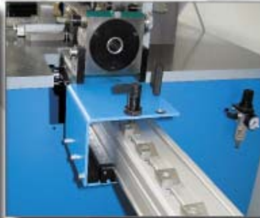
Mechanisches Programm durch Anschläge und Federriegel für Serien