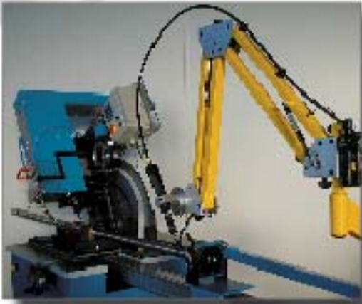
C8: in einer Aufspannung Fließformen und Gewindeformen – gerade oder schräg – bis M12 in Stahl, in VA bis M8 mit Aktionsradius 1800 mm