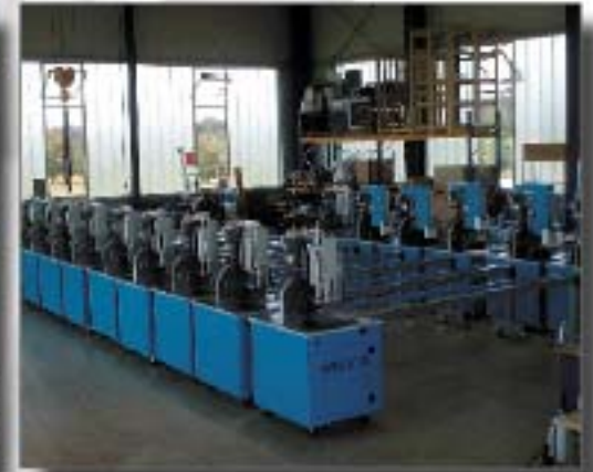
Serie in unserer Montagehalle