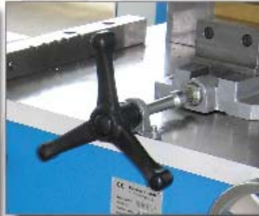
Schnellspannung mit 3-Stern